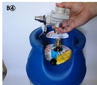
調整器全体を引上げバルブから取外し