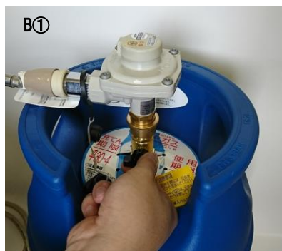
バルブの元弁を閉止