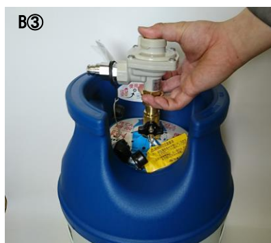
調整器のスリーブ部を引上げ