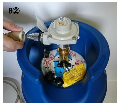
ガスホースのソケット継手を取外し